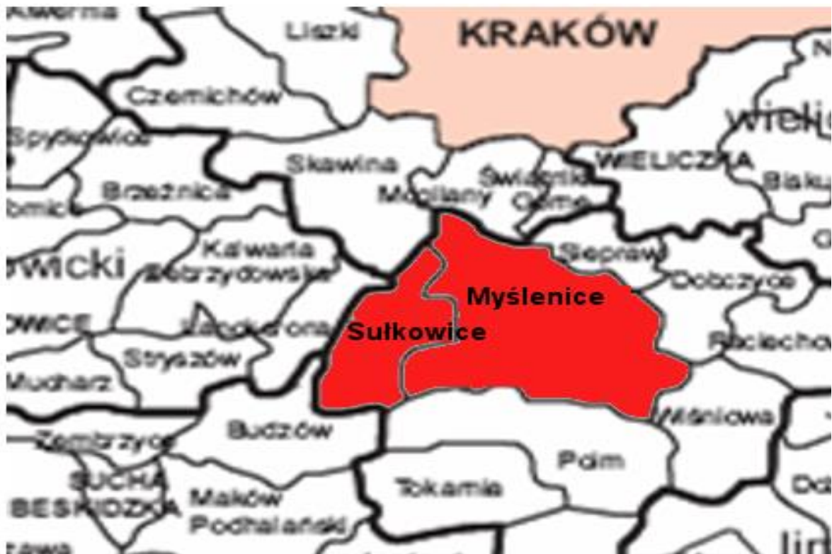
Rysunek 1 Mapa obszaru LGD „MDiG”